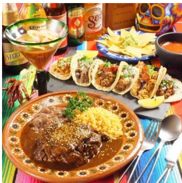
メキシコ料理イメージ

後援: 在日メキシコ合衆国大使館 協賛: DON JULIO 協力: 大阪デザイナー専門学校