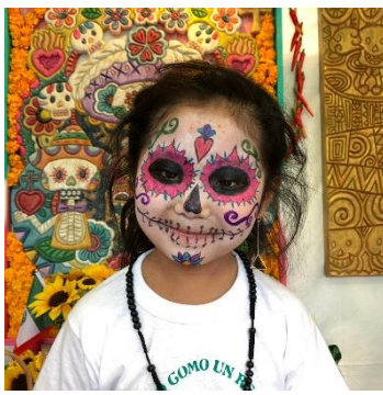
フェイスペイントイメージ