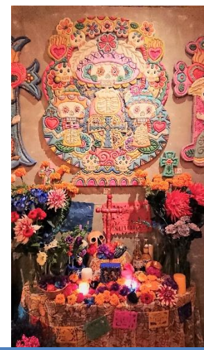
オフレンダ(祭壇)イメージ