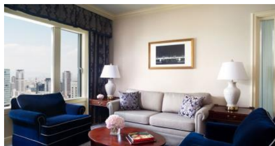
エグゼクティブスイート/クラブスイートのリビングルーム