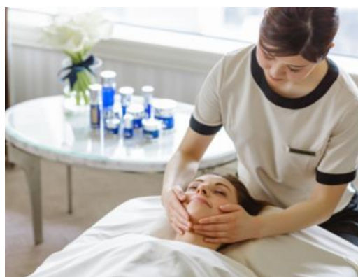
最高級スイートルームでフェイシャルトリートメント

ザ・リッツ・カールトン大阪(所在地:大阪市北区梅田 2-5-25 総支配人:クリストファー・クラーク)は、スイス発のラグジュアリースキンケアブランド「ラ・プレリー」を使ったフェイシャルトリートメントが、最高級スイートルーム「ザ・リッツ・カールトン・スイート」で受けられる 100 万円の宿泊プランを 2019 年 5 月 6 日(月)から販売開始いたします。お部屋には他に、「ラ・プレリー」の世界観をイメージしたオリジナルアフタヌーンティーとグラスシャンパーニュをご用意。大阪市街を一望できるスイートルームで優雅なアフタヌーンティータイムをお楽しみください。また翌朝のご朝食もお部屋にお届けいたします。