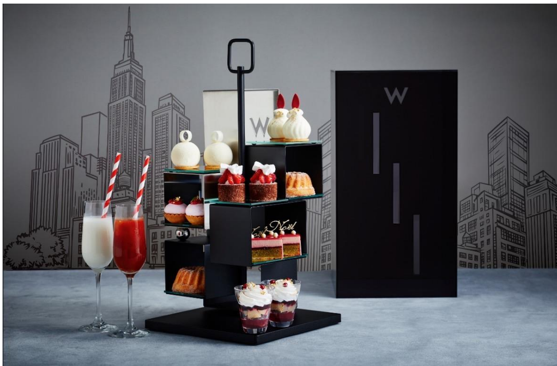
フェスティブ アフタヌーンティー “NEW YORK” のスイーツメニュー

ラグジュアリー・ライフスタイルホテルW大阪（所在地：大阪市中央区南船場4丁目1番3号）は、Wホテル誕生の地、ニューヨークをテーマにした「フェスティブ アフタヌーンティー “NEW YORK(ニューヨーク)”」を、ホテル3階のソーシャルハブ「LIVING ROOM(リビングルーム)」にて2024年11月1日(金)～2025年1月15日(水)までの期間限定で提供いたします。