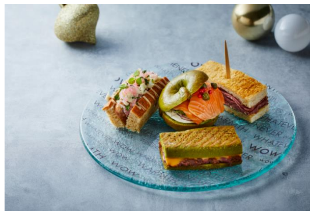
セイヴォリーメニューのプレート