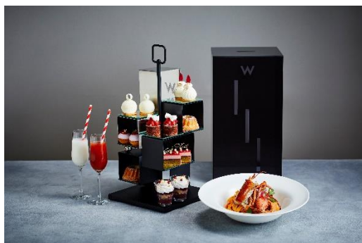
アフタヌーンティー+パスタセット(2名分)