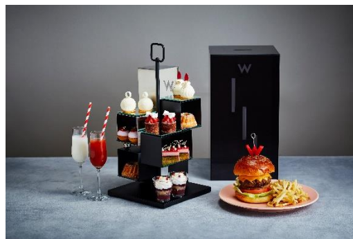
アフタヌーンティー+ハンバーガーセット(2名分)