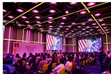
昨年の「WHAT SHE SAID」の様子