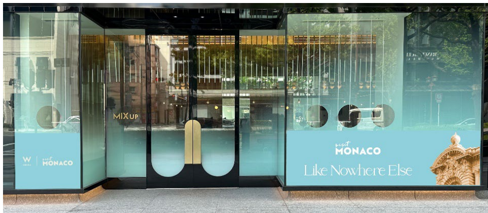
「MONACO Café @MIXup」イメージ図

～2024は旅する1年に！レスポンスブル・ラグジュアリーな渡航地、モナコをテーマにタイアップした期間限定カフェ～