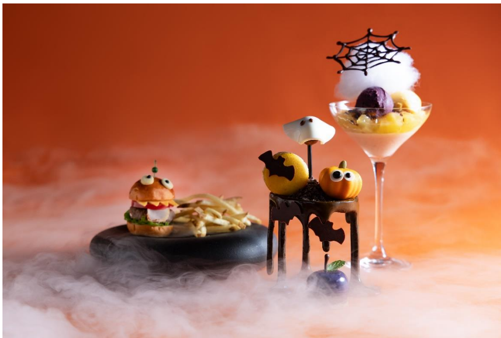
ハロウィンアフタヌーンティー “Monsters Bite”(モンスタース バイト)(イメージ)

ラグジュアリー・ライフスタイルホテルW大阪(所在地: 大阪府中央区南船場4丁目1番3号、総支配人: 近藤 豪)は、2023年10月1日(日)から10月31日(火)までの期間限定で、1階アート・ペストリー・バー「MIXup(ミックスアップ)」にてハロウィン気分を味わえるアフタヌーンティーをご提供いたします。