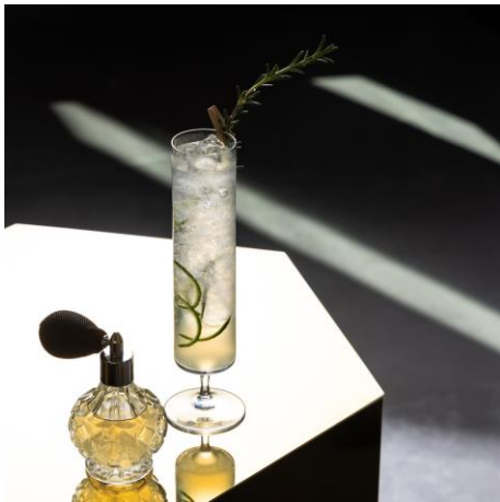
オリジナルカクテル「DESTINATION HONEY」

販売期間 2023年9月13日(水)～9月30日(土) 価 格 2,530円(税・サービス料15%込) 場 所 LIVING ROOM(3階) 予 約 電話:06-6484-5812(レストラン予約) E-mail: w.osaka.restaurantreservations@whotels.com