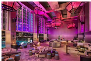
Wクアラルンプール