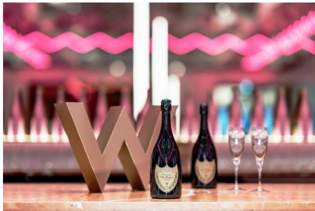
高級シャンパーニュ「ドン・ペリニオン」もフリーフローで贅沢に