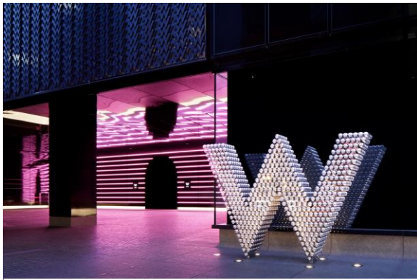
W大阪エントランス