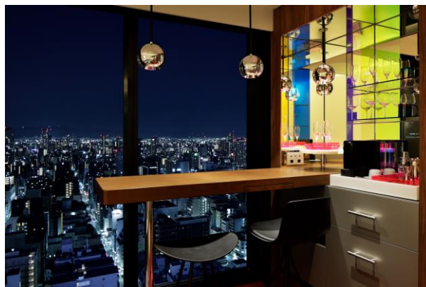
部屋からの夜景(イメージ)