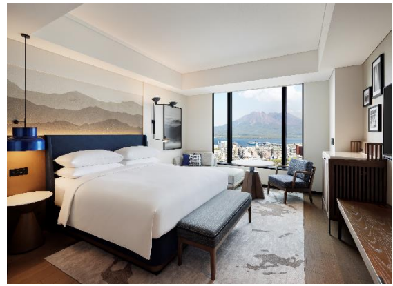
左: シェラトン鹿児島外観 右: 桜島を一望できる客室

マリオット・インターナショナル（本社：米国 メリーランド州、最高経営責任者兼 CEO：アンソニー・カプアーノ）が展開する 31 のブランドの一つ、 シェラトンホテル&リゾート は、「シェラトン鹿児島」を本日開業しました。当ホテルは、シェラトンブランドとしてアジア太平洋地域において記念すべき 150 軒目の施設となると同時に、日本においてシェラトンのグローバルでモダンなデザインコンセプトとブランドビジョンを体現する初のホテルとなります。鹿児島島の桜島を背にした美しい入江に位置するシェラトン鹿児島は、世界中のコミュニティにおいて地元の人々とゲストの両者が集う場所としてのルーツを生かしながら、お客様がつながりや充実感、そして温かさを感じていただける場所として、直感的で包括的な体験を提供します。