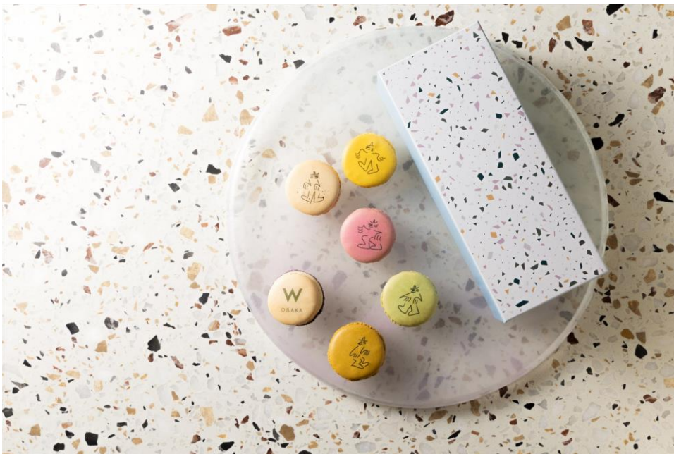
ルーカス アート・マカロン