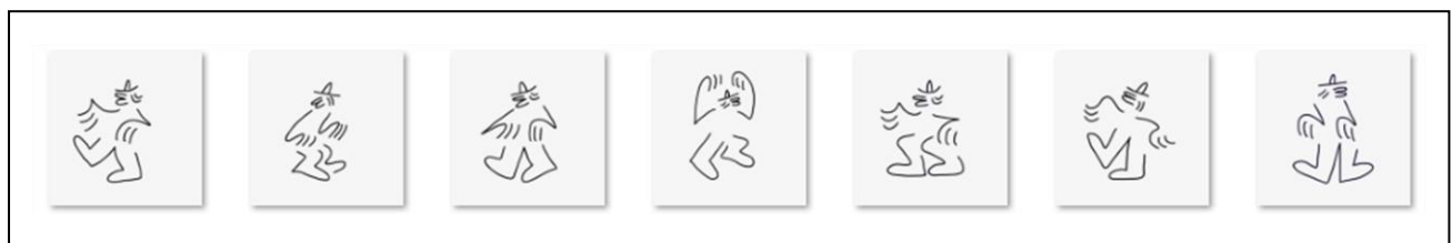
ルーカスの人気キャラクター「GusGus (ガスガス)」