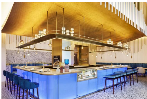
アート・ペストリー・バー「MIXUp」

公式サイト: wosaka.com Instagram: instagram.com/wosakahotel/ Facebook: facebook.com/WOsakaJPN