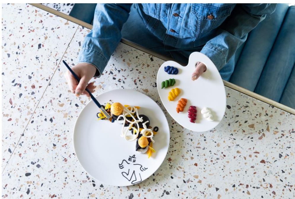
プレートに絵を描くデザート「ART to PLATE(アート トゥ プレート)」

～気分はアーティスト！自由に絵を描くスイーツや、人気キャラクターGusGusのマカロンを数量限定販売～