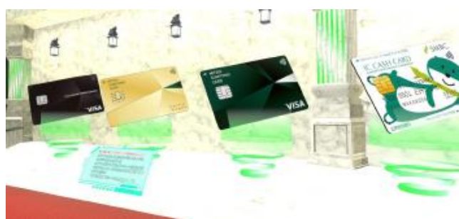
「クレジット、デビットカード」