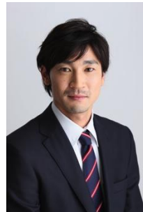
都築 龍太 元サッカー日本代表 サッカー解説者