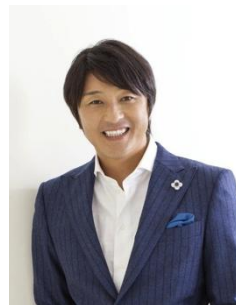
三浦 淳寛 元サッカー日本代表 サッカー解説者