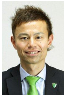
相根 澄 元フットサル日本代表 日本フットサル振興会理事長