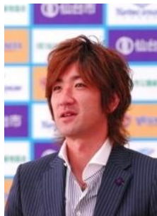
平瀬 智行 元サッカー日本代表 ベガルタ仙台アンバサダー