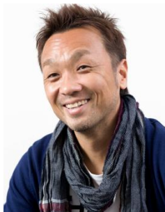
本田 泰人 元サッカー日本代表