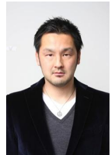
林 健太郎 サッカー解説者