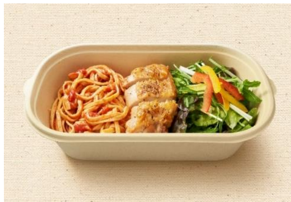
アラビアータとチキンステーキ