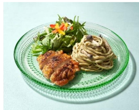
バジルクリームパスタとチキンの山椒焼き