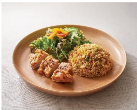
チャーハンとチキンの照り焼き風