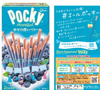
ポッキーハートフル＜幸せの青いベリー＞