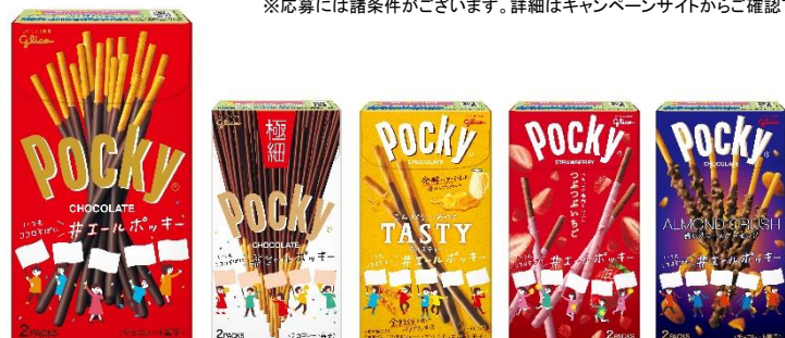
5文字のエールが書ける限定デザインのパッケージ