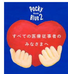
Pocky Book Blue イメージ

中でもひっ迫する医療現場の最前線で日々奮闘してくださっている医療従事者のみなさまに、少しでも穏やかな気持ちになる時間をお届けしたいという思いから、たくさんの方からの感謝と応援の気持ちを「Pocky Book Blue」というひとつのデジタルブックにまとめてお届けする活動を、昨年秋に続き、今年も実施します。キャンペーンサイトから、医療従事者の方々への感謝や敬意、応援のメッセージを集め、一部のコロナ重症センターには募ったメッセージと「ポッキー」を直接お届けするほか、キャンペーンサイトでの掲載に加え、ポッキー公式 Twitter や、勤労感謝の日にグリコビジョン渋谷にも掲載する予定です。