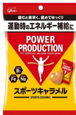
画像：パワープロダクション新商品「スポーツキャラメル」

江崎グリコ創業の商品、栄養菓子「グリコ」は子供の栄養が十分でなかった時代に栄養素グリコーゲン、当時子供たちに人気があったキャラメルに入れて、体位向上に貢献したいという創業者の想いから生まれました。この想いは企業理念「おいしさと健康」として受け継がれ、さまざまな商品やサービスへとその領域を広げております。本商品もお客様の健康に寄り添うべく、時代に合わせた運動時のエネルギー補給として、キャラメルの新しい価値を提案しております。当社はこれからも総合食品メーカーとして、「おいしさと健康」の企業理念の下、新たな健康価値を提案・提供して参ります。