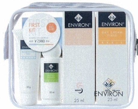
エンviron・ファーストキット 通常価格 ¥7,980 → 期間限定価格 ¥6,384

これからエンvironで紫外線に負けない肌を作りたい方へ、気軽にエンvironの効果を実感いただけるファーストキットを、キャンペーン期間限定で20%offに。この機会にエンvironを是非お試しください。