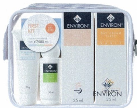
エンviron・ファーストキット 通常価格 ¥7,980 → 期間限定価格 ¥6,384

エンvironは、医療先進国である南アフリカの形成外科医Dr.フェルナンデスによって、研究開発された製品です。強い日差しが降り注ぐ南アフリカでは、紫外線対策が必要不可欠。紫外線を受けることで肌から失われるビタミンAを補い、且つ様々な要因から肌に悪影響を与える活性酸素を抑える働きをする抗酸化ビタミン類により、肌のダメージを補修・予防します。エンvironは1人ひとりのお肌の個性に合わせて最善のケアの方法を選択するため、シワ、シミなど皮膚の老化やダメージを健やかにしていくカウンセリングスキンケアシステムをおこなっています。ぜひこのチャンスに、エンvironのスキンケアをご体験ください。