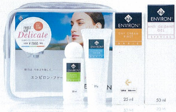
エンviron・ファーストキットデリケート 通常価格 ¥7,665 → 期間限定価格 ¥6,132