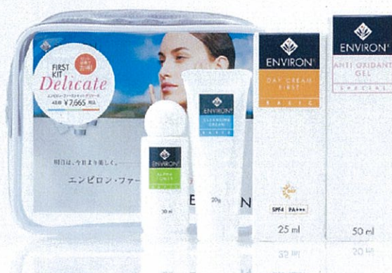
エンviron・ファーストキットデリケート 通常価格 ¥7,665 → 期間限定価格 ¥6,132