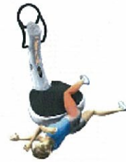
リラクゼーション