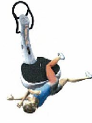
リラクゼーション