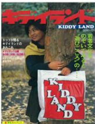
旬刊ファンシー141号別冊 （昭和60年1月5日発行）

キデイランドが、表参道において1983年からハロウィーン・パレードを実施開催している根拠としまして、第三者である、添付の雑誌「旬刊ファンシー第141号別冊（昭和60年＝1985年1月5日／株式会社文化用品産業新聞社 発行）」に掲載されている、当社原宿店主催によるハロウィーンパレード告知のフライヤー（チラシ）があります。当該ページの記事を見ると、キャプションとして「59年10月、HALLOWEEN（原宿店）」とあります。（昭和59年というのは、この雑誌発行の前年ですが、フライヤーには「今年も例年のように、」という文章が見られ、このフライヤー発行の前年である昭和58年＝1983年には少なくとも、ハロウィーンパレードを開催していることが分かります。実際には1982年以前にもハロウィーンパレードを開催している可能性が大いにあるのですが、現在当社で所持している資料では、この1次資料がもっとも古いものとして根拠として採用できるため、公式には「1983年から表参道においてキデイランド原宿店が主催してハロウィーンパレードを開催した」とさせていただきます。