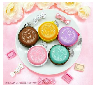
マカロンケース 5 種 各 480 円+税 ※8/上旬~