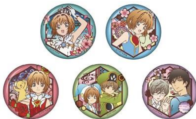
切り絵シリーズ 和紙缶バッジ 5 種 各 380 円+税 ※7/13(金)~