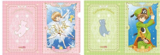
クリアファイルセット さくらと小狼 1 種 (2 枚組) 700 円+税 ※7/13(金)~