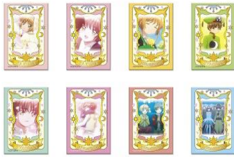
スクエア CAN バッジ vol.4 8 種 各 450 円+税 ※7/28(土)~ *ブラインド商品につき、柄は選べません。