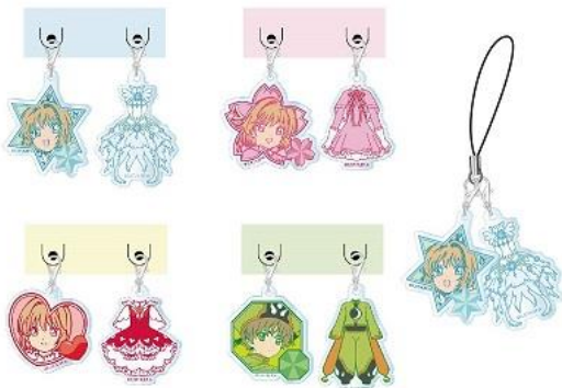
アクリメトリー 4 種 各 850 円+税 ※7/13(金)~