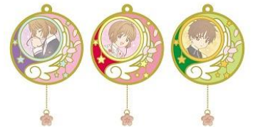
スタンドメタルチャーム 3 種 各 1,500 円+税 ※7/13(金)~