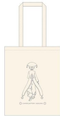
うしろ向きトートバッグ (小狼) 1 種 1,500 円+税 ※7/13(金)~