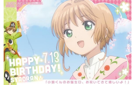
ポストカード(さくら Ver.)