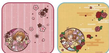
切り絵シリーズ ガーゼミニタオル 2 種 各 750 円+税 ※7/13(金)~