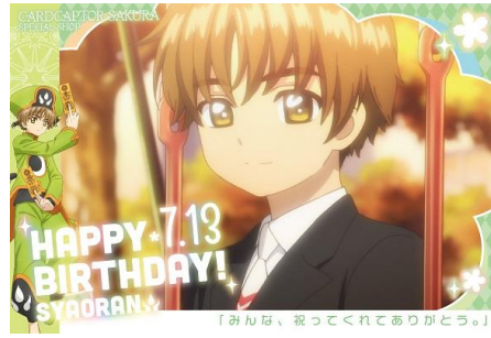
ポストカード(小狼 Ver.)

■タカラトミー「カードキャプターさくら」HP: www.takaratomy.co.jp/products/ccsakura/