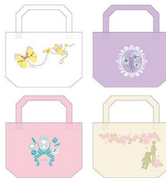
ミニトートバッグ 4 種 各 1,600 円+税 ※7/13(金)~