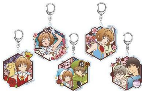
切り絵シリーズ アクリルキーホルダー 5 種 各 800 円+税 ※7/13(金)~