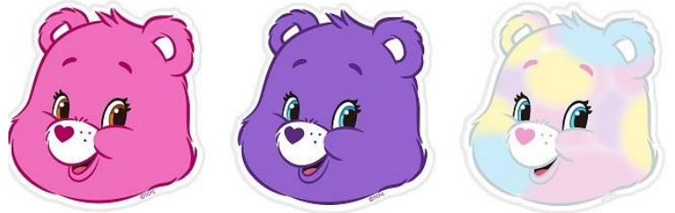
ダイカットタオル 全3種 各850 円+税 (チア・ベア™ /シェア・ベア™ /トゥルーハート・ベア™ )