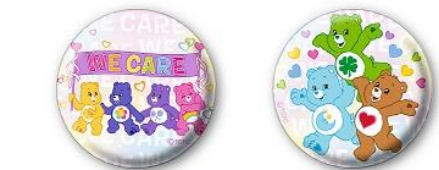
キラキラ缶バッジ 全5種 各350 円+税 (チア・ベア™ /チア・ベア™ と仲間達/ 集合/ WE CARE/ハート)