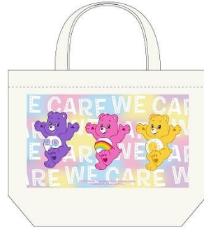
ランチトートバッグ 1,200 円+税