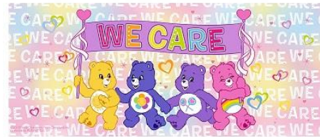
フェイスタオル 2,000 円+税