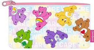
ラメ入りペンポーチ 1,350 円+税