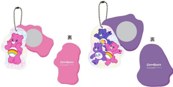
ラメ入りアクリルスライドミラー (チア・ベア™ /集合) 全2種 各1,200 円+税