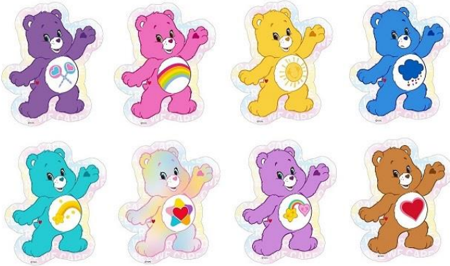
ダイカットステッカー 全8種 各300 円+税 (シェア・ベア™ /チア・ベア™ /ファンシャイン・ベア™ / グランビー・ベア™ /ウィッシュ・ベア™ /トゥルーハート・ベア™ / ベストフレンド・ベア™ /テンダーハート・ベア™ )