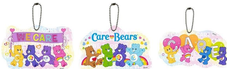
アクリルキーホルダー 全7種 各650 円+税 (チア・ベア™ /ベストフレンド・ベア™ /グランビー・ベア™ / ファンシャイン・ベア™ /WE CARE/ Care Bears™ / CARE)