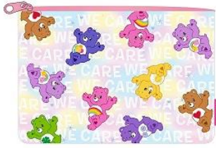
ラメ入りフラットポーチ 1,600 円+税