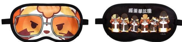
羅巢華流團 アイマスク 1,000 円+税