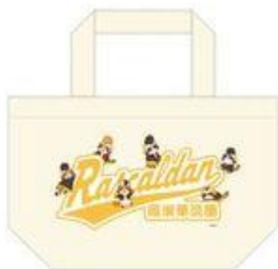
羅栗華流團 ランチトート 1,667 円+税