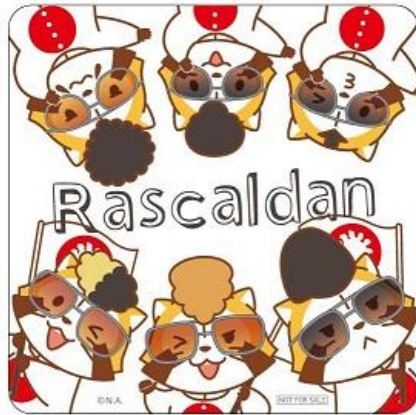
羅巢華流團ステッカー

■“羅巢華流團”商品を含むラスカルグッズを 2,000 円（税込）以上お買上げの方に、「羅巢華流團ステッカー（非売品）」をプレゼント。また、“羅巢華流團”商品を含むラスカルグッズを 2,000 円お買上げ毎に、「氣志團メンバーサイン色紙」が抽選で 10 名様に当る応募券をプレゼントします。 ※無くなり次第終了。 ※ハガキでお申しいただきます。詳しくは応募券に記載。