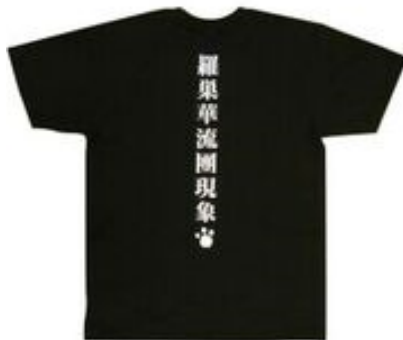
羅栗華流團 Tシャツ 各 4,000 円+税