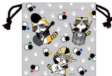
羅栗華流團 巾着 600 円+税