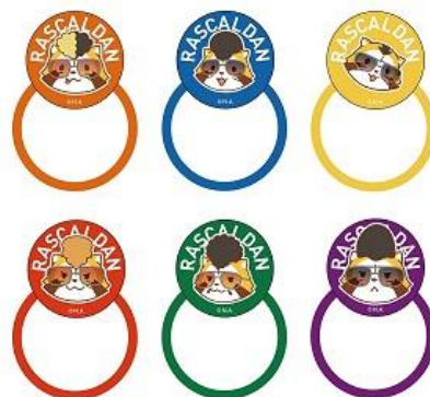
羅栗華流團 ヘアゴム 6種 各 556 円+税