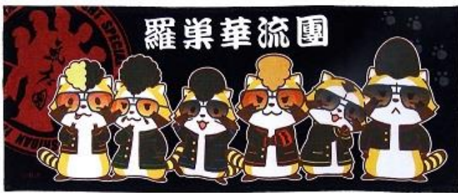
羅巢華流團 フェイスタオル 1,500 円+税