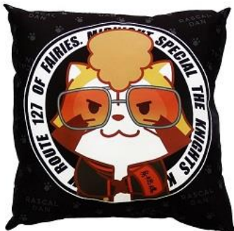
羅巢華流團 クッション 3,000 円+税