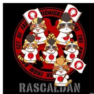
羅巢華流團 ハンドタオル 741 円+税