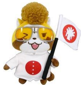
羅栗華流團 めいぐるみ 2,800 円+税