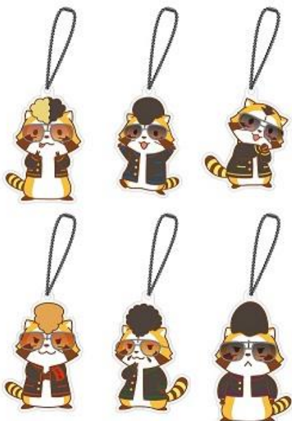
羅栗華流團 アクリルキーホルダー 6種 各 648 円+税