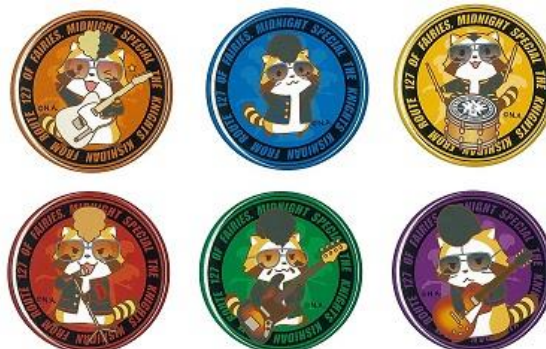
羅栗華流團 缶バッジコレクション ※6種ブラインド仕様 各 400 円+税