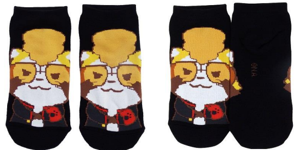
羅巢華流團 ソックス 600 円+税