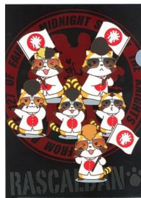
羅栗華流團 クリアファイル 2種 各 400 円+税