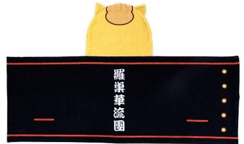
羅巢華流團 フードタオル 3,200 円+税