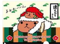
A4クリアファイル 230円+税