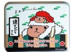
缶キャンディ 580円+税