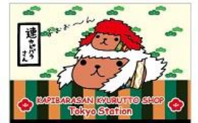
ポストカード 150円+税