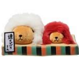
連獅子～んぬいぐるみ 3,500円+税

■4周年を記念し、日本の伝統・文化をイメージした東京駅店限定商品 13 アイテム(SKU)を7月4日(土)より販売。