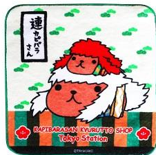
プリントタオル 600円+税