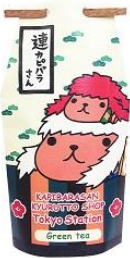
煎茶 (ティーパック7包入り) 850円+税