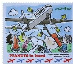
メガネクロス 600 円+税