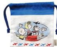
巾着 上段・表、下段・裏 650 円+税