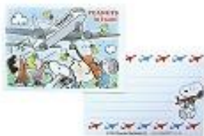
メモ 280 円+税