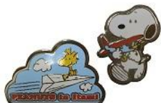
ピンバッジセット (限定 100) 1,380 円+税