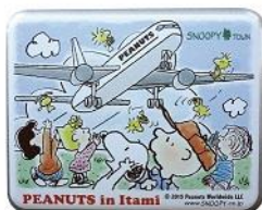
キャンディ缶 (いちごみるく味) 580 円+税