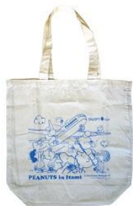
エコバッグ 500 円+税