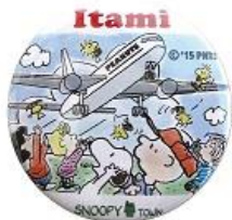
缶バッジ 200 円+税