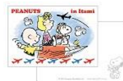
ポストカード 2 枚セット 300 円+税