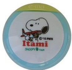
e-ma のど飴 380 円+税