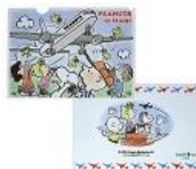
クリアファイル A4 280 円+税