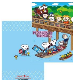
クリアファイル A4 280 円(税抜)