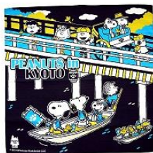
小風呂敷 限定 200 個 850 円(税抜)