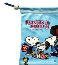
スマホクリーナー巾着 900 円(税込)