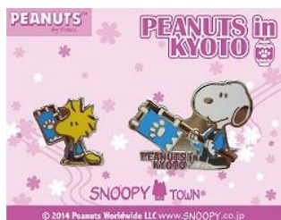
ピンバッジセット 限定 200 個 1,300 円(税抜)