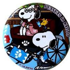
缶バッジ 200 円(税抜)