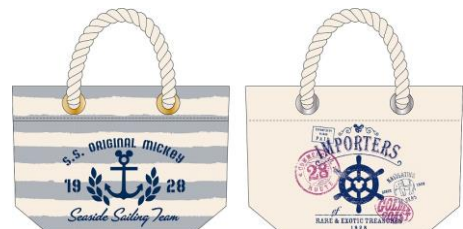
神戸限定 トートバック(全2種) 各 1,200円+税