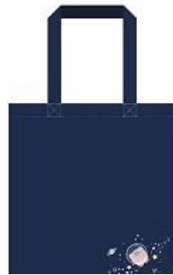
トートバッグ 2,300円+税