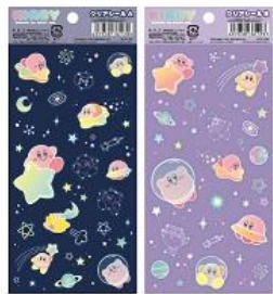
クリアシール(2種) 各300円+税