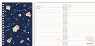
B6リングノート(2種) 各500円+税