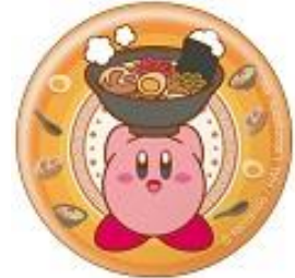
九州/「福岡博多ラーメン」