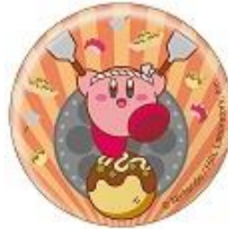
関西/「大阪たこ焼き」