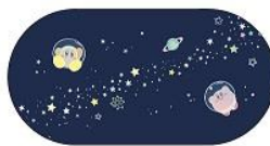
メガネケース 1,600円+税