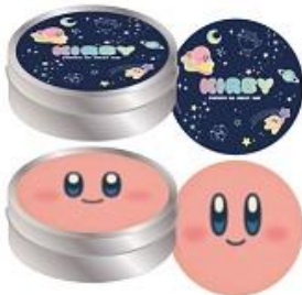
缶入りメモ(2種) 各650円+税