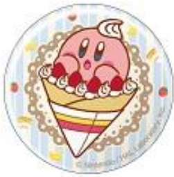
東京/「原宿クレープ」