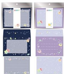
レターセット(2種) 各600円+税