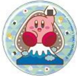
中部/「富士山おにぎり」