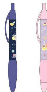
ボールペン(2種) 各600円+税