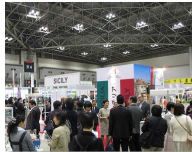
「オーガニックEXPO2014」初日の様子

初日となる本日は企業関係者を中心に一般の方も数多く来場され、改めてオーガニックに対する関心の高さが伺え、大盛況で1日目を終了いたしました。残りの2日も関連セミナーなど多くのオーガニックイベントをご用意しています。この機会にオーガニックの魅力を存分に体感していただければ幸いです。