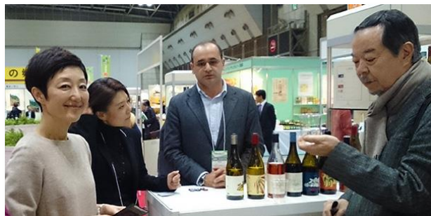
「オーガニックEXPO2014」初日の様子