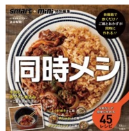
宝島社より好評発売中

雑穀エキスパート/ごはんソムリエ/薬膳インストラクター/雑穀マイスター/発酵食スペシャリストの資格を持つ。