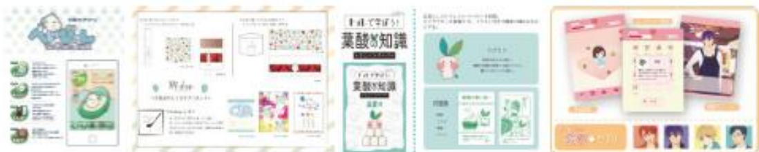
プロジェクト作品例