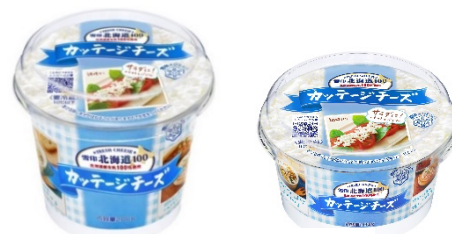
左：200g / 右：100g

クセがないので、サラダだけでなく、いろいろなメニューにお使いいただける「意外と使えるチーズ」です。