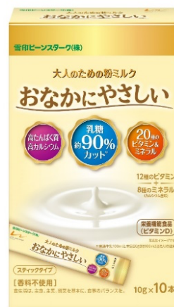
スティックタイプ