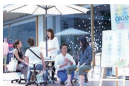
ウッドデッキスペース