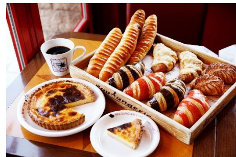
10月12日(土)～10月14日(月・祝) パンフェス開催日のため 全5種類を販売