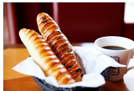
10月21日(月)～10月25日(金) ヴィエノワ プレーン200円/チョコチップ220円