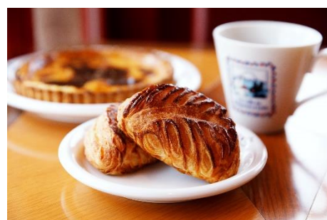
10月15日(火)～10月20日(日) ソションオボム 280円