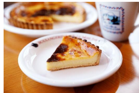
10月26日(土)～11月4日(月・祝) フラン(冷蔵) 250円

■ H P https://www.fujiq.jp/event/collabobread.html