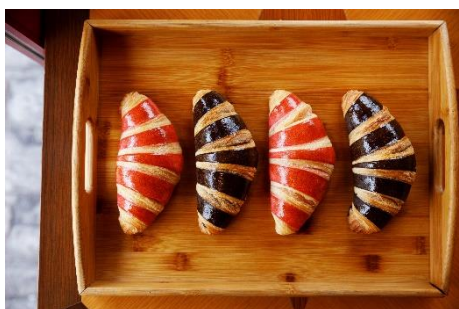
10月1日(火)～10月6日(日) ストライプクロワッサン (チョコレート/ストロベリー) 各330円