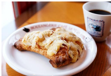
10月7日(月)～10月11日(金) クロワッサンダイヤモンド 300円