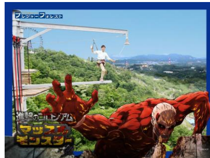
▲「お写真撮りマッスル」進撃の巨人オリジナルフォトフレーム