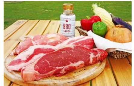
「ごろっと3種盛「Wild BBQ SET300」」