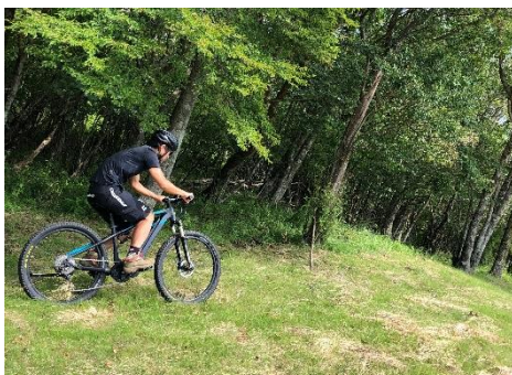
マウンテンバイクパーク

・パンプトラック用ストライダーレンタル: 30 分 500 円(税込)※ヘルメット必須