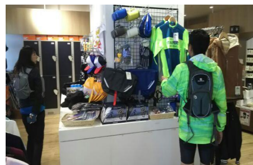
自転車関連グッズ