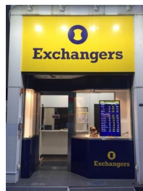
エクスチェンジャーズ