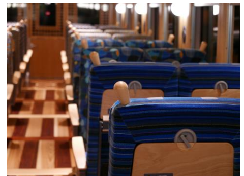
※富士山ビュー特急車内イメージ