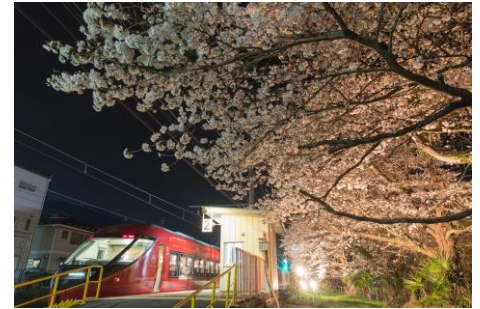
※東桂駅 夜桜ライトアップの様子

http://www.fujikyu-railway.jp/sakura2018/