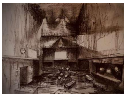
プレシヨールーム