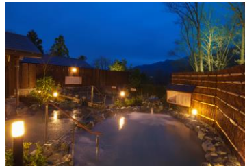
さがみ湖温泉うりり