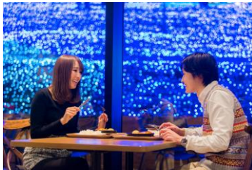
レストラン「ワイルドダイニング」

園内中心部にあるレストラン「ワイルドダイニング」では、イルミネーションの幻想的な景色とともに温かい料理を楽しめるほか、日帰り温泉施設「さがみ湖温泉うりり」も隣接しており、“イルミネーション”と“温泉”という冬の醍醐味を満喫することができます。隣接するアウトドア施設「PICA さがみ湖」では、BBQ や焚火、宿泊もでき、1日を通して丸ごと遊園地を楽しむことができます。