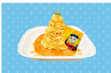
レベッカのハロウィンパンケーキ (パンプキンとメイプル味) 650 円