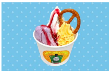
パンプキンホイップと紫いもの アイスクリームサンデー 650 円