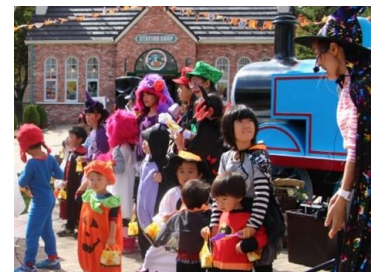
※画像は過去のものです