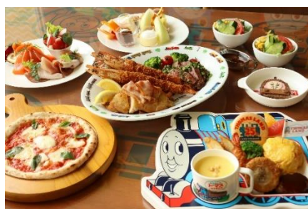
トーマスルーム・パーティーセット