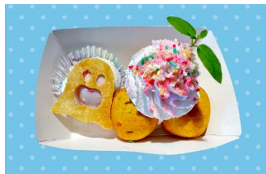
おばけの3色アイスと カボチャドーナツ 900 円