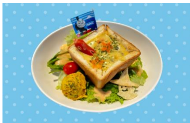
カボチャシチューの いたずら BOX 1,300 円