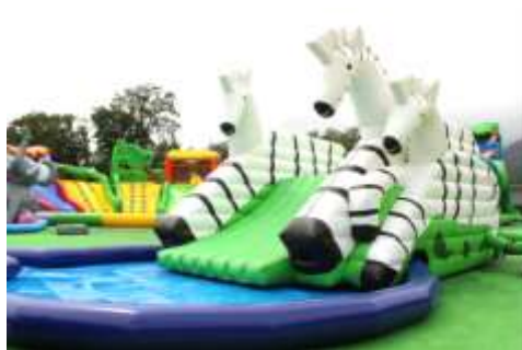
シマウマスライダー