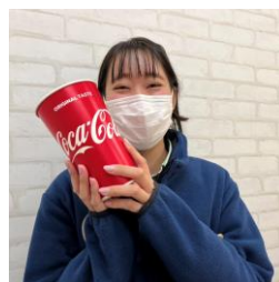
ソフトドリンクは顔よりも大きいコップでなんと通常の倍サイズ！