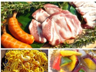
※カジュアルプラン