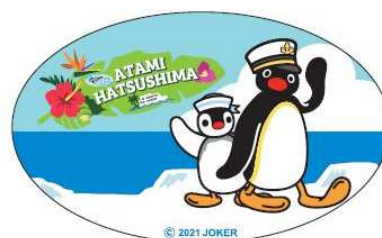
缶バッジ (イメージ)