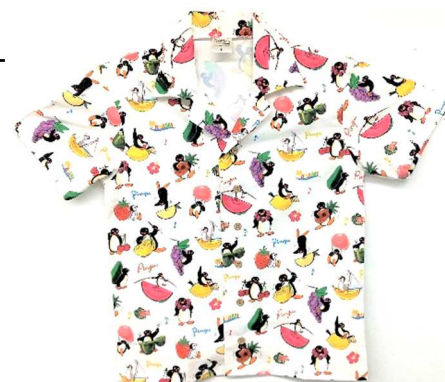
アロハシャツ（イメージ）