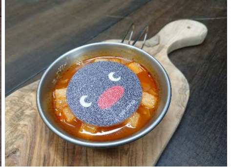
PINGU~ミネストローネ~ 600円(税込)