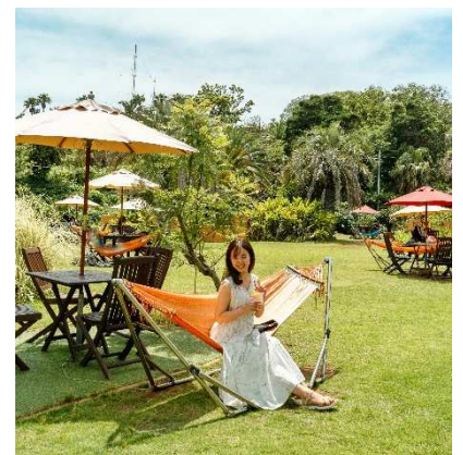
アジアンガーデン R-Asia

★特典★ コラボメニューをご購入の方に、南国リゾートを楽しむピングー、ピンガ、ロビのオリジナルイラストが描かれたステッカー(全3種)をプレゼントいたします。 ※1会計につき1枚、ランダムでのお渡しとなります。