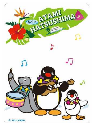
クリアカード (イメージ)