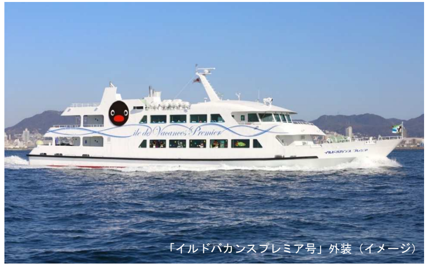
「イルドバカンスプレミア号」外装（イメージ）

静岡県熱海市にて熱海～初島航路を運航する株式会社富士急マリリゾートでは、スイス生まれの人気キャラクター「PINGU（ピングー）」の40周年を記念して、2021年12月4日（土）～2022年2月23日（水祝）の期間、コラボイベントを初開催いたします。