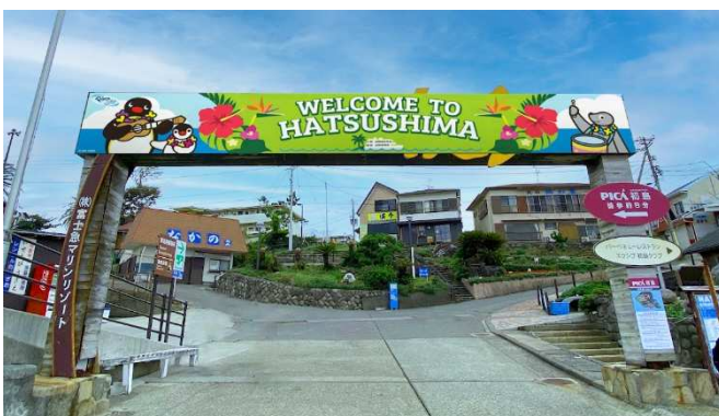
初島港ウェルカムゲート (イメージ)

南国感満載のペンギーやなかまたちが出迎えてくれるウェルカムゲートや、どこまでも広がる海をバックにペンギーやピンガと記念撮影が楽しめるフォトスポットが登場いたします。