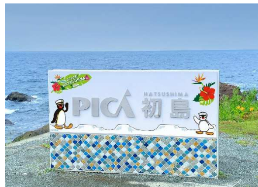
海岸沿いフォトスポット (イメージ)