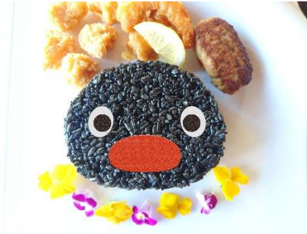
PINGU~ガーリックシュリンプセット~ 1,500円(税込)

【ピングーコラボメニュー (イメージ)】 ※実際の提供メニューは写真と異なる場合があります。