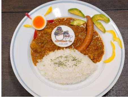
PINGU~初島カレー~ 1,500円(税込)