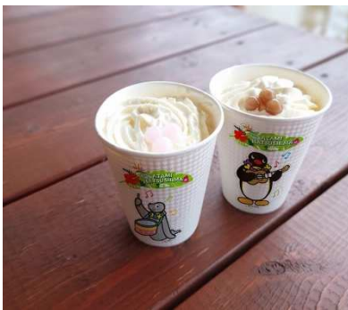
PINGU~タピオカドリンク~ (ホット/アイス) 700円(税込)