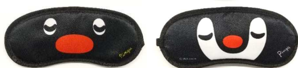
アイマスク（イメージ）

★特典①★ コラボルームにご宿泊の方に、女性に人気のフルーツ柄イラストが散りばめられたアロハシャツと寝顔のペンギーとピンガが両面にプリントされたアイマスクをプレゼントいたします。どちらもここでしか手に入らない数量限定のプレミアム品です。