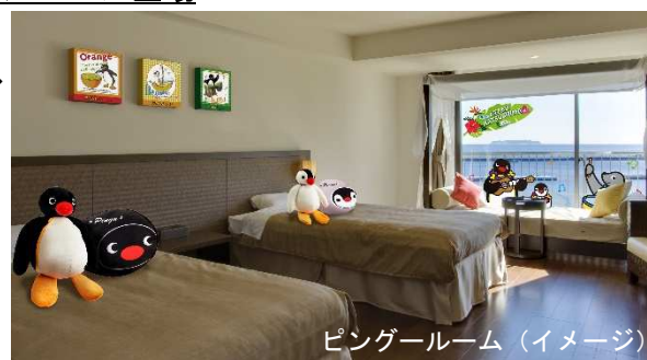
ペンギンルーム（イメージ）

熱海サンビーチ沿いに位置する全室オーシャンビューの温泉リゾートホテル「熱海シーサイドスパ&リゾート」に、ペンギーコラボルームが2部屋限定で登場いたします。コラボルームにご宿泊のお客様しか手に入らないプレミアムなアロハシャツとアイマスクを身に着けて、たくさんのペンギーやなかまたちに囲まれながら、ウェルカムスイーツに舌鼓…というとおきのプライベートタイムをお過ごしいただけます。