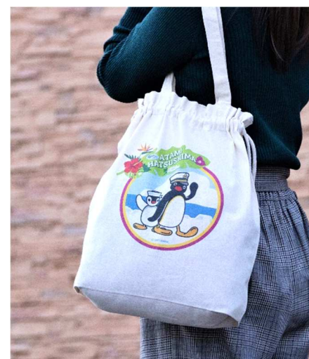
巾着トートバッグ（イメージ）