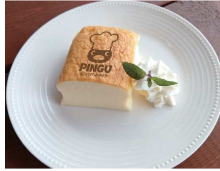
PINGU~台湾カステラ~ 600円(税込)