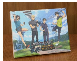
アートボード 大 1,900円(税込) 中 1,500円(税込)