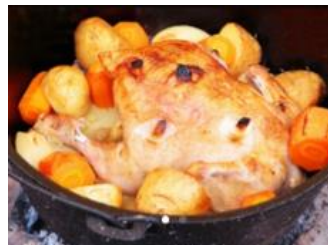
夕食メニューイメージ 鎧の巨人の硬質化ダッチオープン スタフドチキンセット