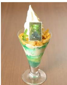
巨人潜む巨大樹の森サンデー 1,000円(税込)

遊園地に隣接する「さがみ湖温泉うるり」では、館内が「進撃の巨人」バージョンに飾り付けられるほか、オリジナル手ぬぐい付きの入館チケット(前売・当日券)やコラボデザート販売いたします。また、「進撃の巨人」の世界をイメージした2種類のアロマ「巨大樹の森林の香り」と「初めてみた壁の向こうの海の香り」が楽しめる岩盤浴(※中学生以上から利用可)も登場いたします。