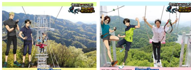
<風天フォトフレームイメージ>