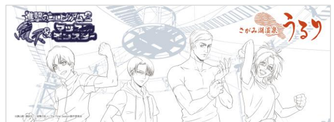
オリジナル手ぬぐいイメージ

※ノベルティとして、遊園地レストランと同デザインのコースターを1品につき1枚ランダムで配布します。