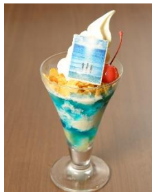
自由を夢みた海のサンデー 1,000円(税込)