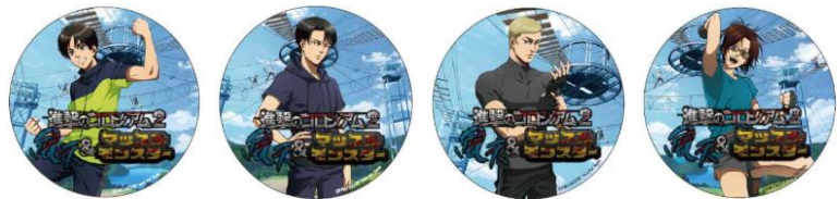
コースター全4種イメージ