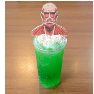
超大型スパークリングドリンク襲来 ~駆逐してやる...1種類残らず...! 全3種 各800円(税込)