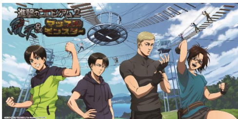
バスタオルイメージ