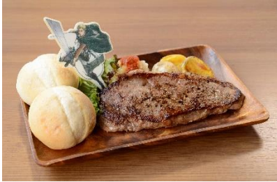
進め!!! エルヴィン団長のマッスルステーキプレート 2,500円(税込)