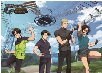
ランチオンマットイメージ