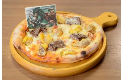
目指すは完全試合。 獣の巨人のゴロゴロ投石ピザ 2,100円(税込)