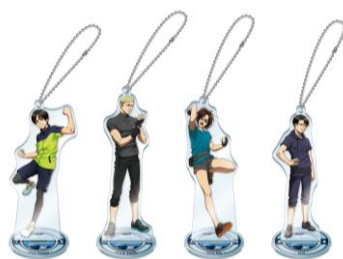
アクリルスタンド キーホルダー 1,300円(税込)