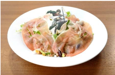
エレンが削ぎ落した 超大型巨人のほほ肉サラダ 1,600円(税込) (※コースター2枚付き)