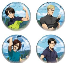
缶バッジ (4種ランダム) 510円(税込)

ショップ「プレジャーステーション」にて、描き下ろしビジュアルを使用した缶バッジやアクリルスタンドキーホルダー、アートボードなど、ここでしか手に入らないオリジナルグッズを多数販売いたします。なお、ご購入に際し個数制限を設けさせていただきます。イベント終了後には、一部の商品について公式オンラインショップにて事後物販を予定しております。完売商品の取り扱いはございませんので、ご了承ください。