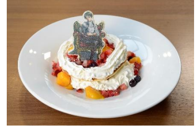
人類最強の男 ~リヴァイの午後のお茶会セット~ 1,900円(税込)