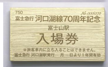
富士山駅入場券(表・裏)