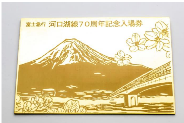
河口湖線開業70周年記念「純金」3駅共通入場券（表）

昨年8月に河口湖線（富士山駅～河口湖駅）が開業70周年を迎えたことを記念して、雪化粧の雄大な富士山と沿線の河口湖大橋、富士吉田市の花「ふじざくら」と富士河口湖町の花「月見草」といった河口湖線沿線の自然の写真を最新のレーザー加工技術によりゴールドプレート上に表現した純金製の入場券です。入場券としては「日本一高い入場券」（※当社調べ）となります。なお、ご購入いただいた方には専用額を贈呈いたします。