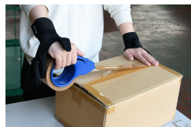
リストバンド固定で手袋を無くさない