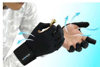
手のひらの蒸れを気にせず長時間作業が可能