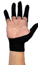
Mサイズ着用イメージ