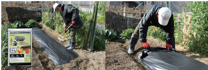
10mの生分解性マルチシート

生分解性マルチシートとしては初となる10m使い切りパッケージタイプです。農家さんの試しに試してみたいという要望や、家庭菜園や貸し農園での使用におすすめです。近年増加している貸農園では家族で野菜を育てながら、子供と一緒に環境問題を考えるきっかけになってほしいと考えています。