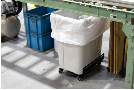
機械の下のゴミ箱が取り出しやすくなります