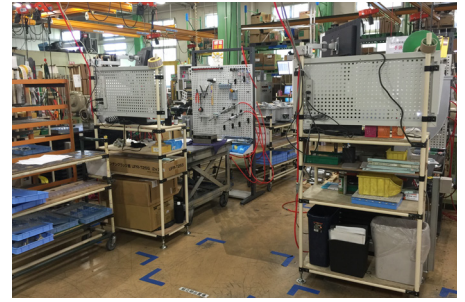
様々な物が自由に移動できる 5S が進んだ工場

私たちは、他社工場を訪問する中で、業績が良く現場が綺麗な企業のゴミ箱は、共通して移動ができるようになってきていることに気がしました。ゴミ箱を移動できるようにしている企業の現場責任者および経営者に、その理由を詳しく聞いてみると、「作業レイアウトが自由に変更しやすい」、「ゴミをすぐに捨てられる環境を作ることが美化につながる」、「直置きすると、ゴミ箱周辺にゴミが溜まり、動かすことでゴミが拡散する。だから、 ゴミ箱を移動できるようにしている 」。これらの回答から、私たちは「 移動ができる 」という点に着目しました。