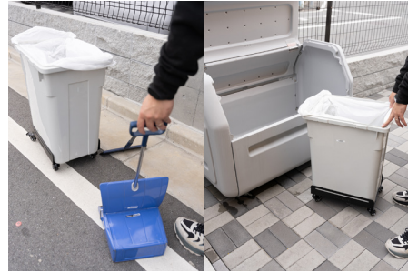
屋外キャスターで屋外清掃の際にも便利