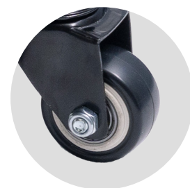
屋外用キャスター